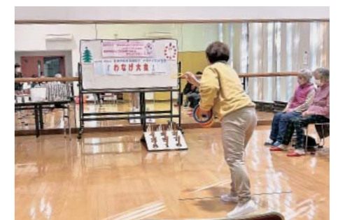
輪投げ大会が各支部に広がっています