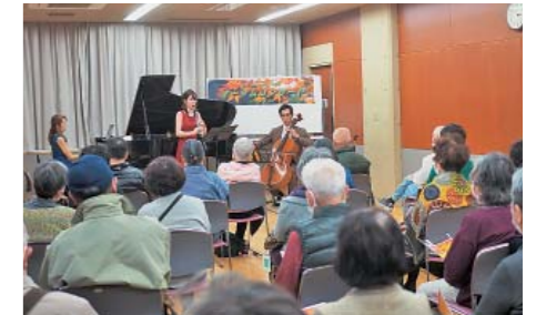
オータムコンサート 文化の秋を満喫