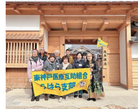
神戸港の原点、兵庫津の歴史を楽しく学びました