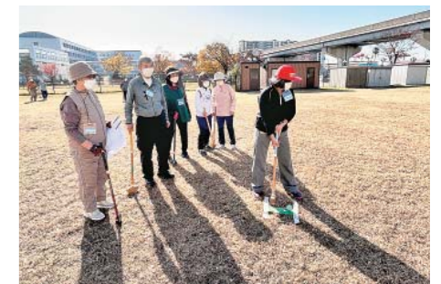
東灘区6支部合同グラウンド ゴルフ大会に80人が参加